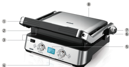
Общий вид передней панели